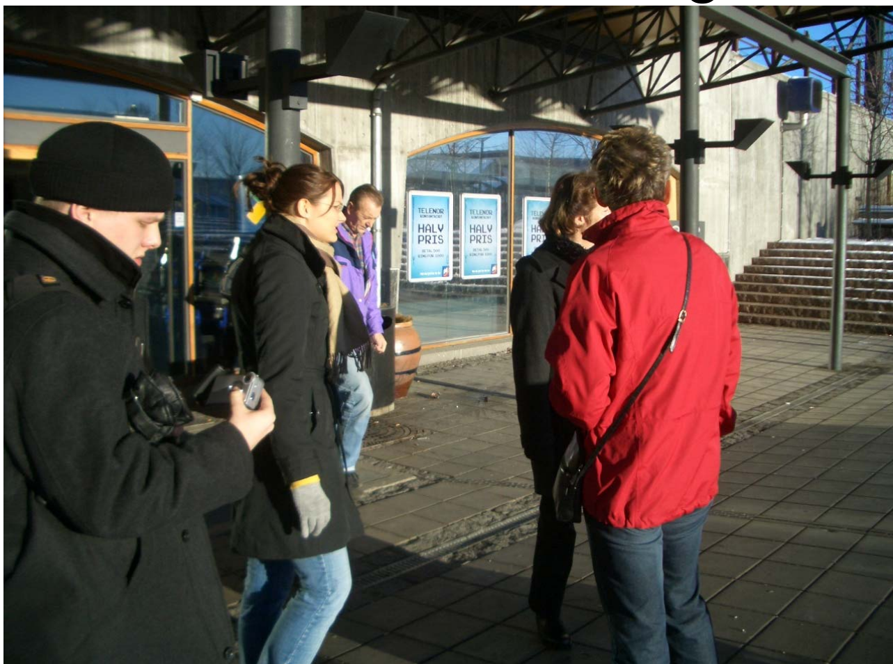
På äventyr i Skedsmo

På fredagmorgonen den 21 januari åkte sex studerande och två vuxna Karisbor iväg till Norge för att medverka i ett vänortsseminarium. Efter den en och en halvtimmes långa flygfärden landade vi i Oslo där vi träffade de övriga nordborna