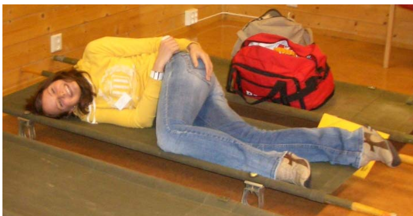
De fruktade armébåraarna och en av Snillets journalister