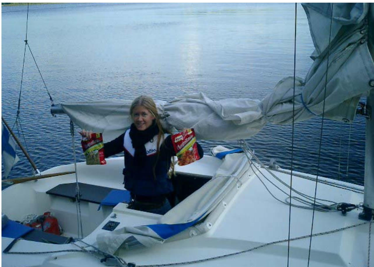
Saras segel eller...

Efter ett fåtal provseglatser i Ekenäs skärgård forslades båten min iväg till min farfar, som turligt nog försett sig med rejäla förvaringsutrymmen. Där står den nu i väntan på att slipas, tvättas och botenmålas inför sjösättningen i vår. En klar fördel med att vara hästägare i detta fall är ju att hästen varken