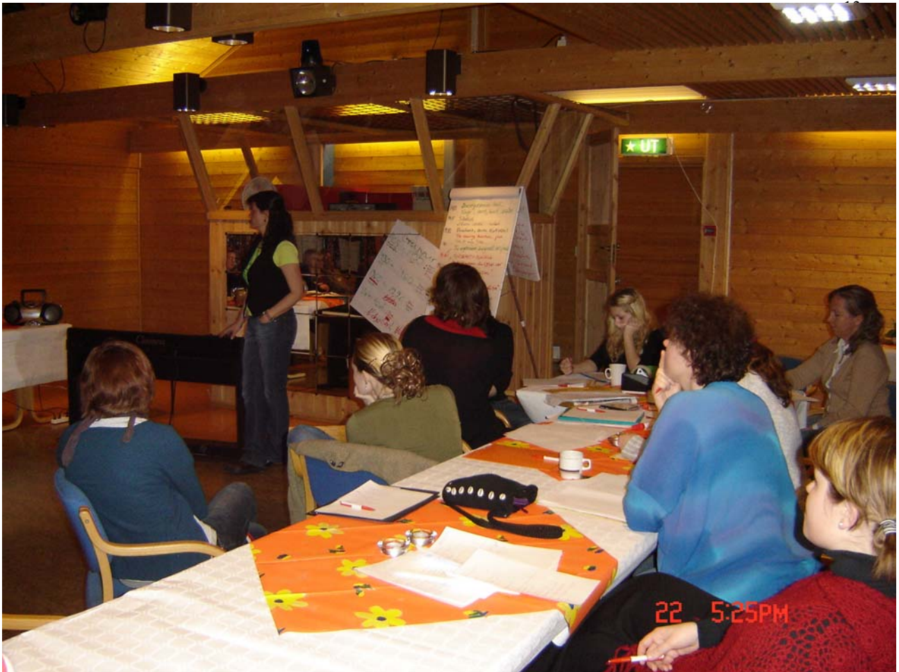
Planering på gång, på hösten kommer resultatet

demokrati, rasism och självständighet och med dessa ord i baktanken planerades och skapades intensivt nummer efter nummer. Meningen är att ca 40-60 personer från varje ort skall delta antingen i körer, som skådespelare eller dansare eller i orkestern som består av storband, blåsorkester och stråkar beroende på vilka resurser man har att erbjuda i de olika orterna. Musiken är bärande i musikalen, och musikstycken från 1905-2005 från varje land skall tillsammans med en historisk baktanke ge en blick 100 år tillbaka i det nordiska förflutna. Genom stora diabilder skall publiken också kunna blicka tillbaka i historien. Resultatet av helgen var positivt och de fyra vänorterna samarbetade bra och det fanns gott om idéer. Hela innehållet fastslogs och alla musikstycken utvaldes .